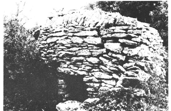
Cabane n° 27 - Parcelle 569.

Description : cabane quadrangulaire simple dégagée de tout appui, au milieu des taillis. Entièrement construite en pierres sèches, non retaillées, cette cabane présente une architecture très rudimentaire traduisant le travail d'un amateur. Certaines assises de pierres sont ainsi en diagonale par rapport aux autres (horizontales). Appareillage en pierres de grosseurs variées. Construction grossière.