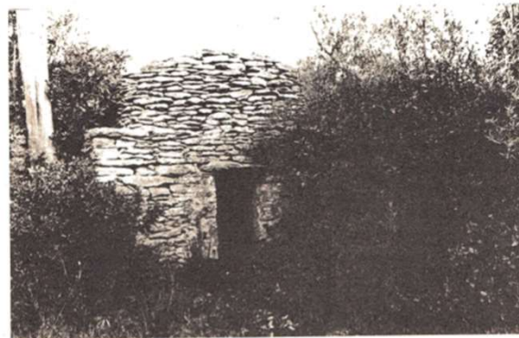
Cabane n°15 - Parcelle 541.

Hypothèses : Le cyprès coupé permet-il de donner une date d'usage de la cabane ? Il est lié paysagèrement à celle-ci, cependant il a certainement été planté près de la cabane déjà existante. Environ 75 cernes ont été comptés.