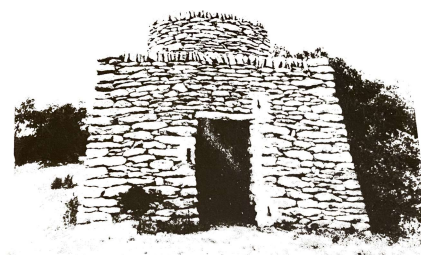
Cabane n°24 - Parcelle 564. "Cabane de l'Arabe".

Description : cabane à base carrée surmontée d'une tourelle, dégagée de tout appui, au bord d'un chemin. linéau monolithe horizontal surmonté d'une lucarne de décharge visible seulement depuis l'intérieur. Pieds-droits et chaînages d'angles formés de grosses pierres. Murs terminés par des épis en petites pierres très plates. Appareillage en petites et moyennes pierres. Tourelle bâtie en petites pierres régulières terminées par un épi. Dessus de la tourelle en cailloutis.