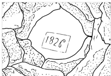
Villevieille (Gard) : dalle terminale millésimée. □

Remise agricole avec fermeture (gonds bien visibles).