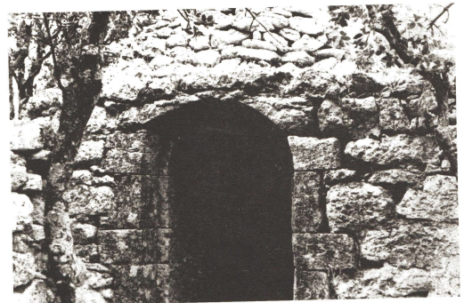
CABANE N°50 PARCELLE 593 QUARTIER PALLAIS/FONT DE L'AUBE Linteau monolithique en plein cintre en pierre de taille.