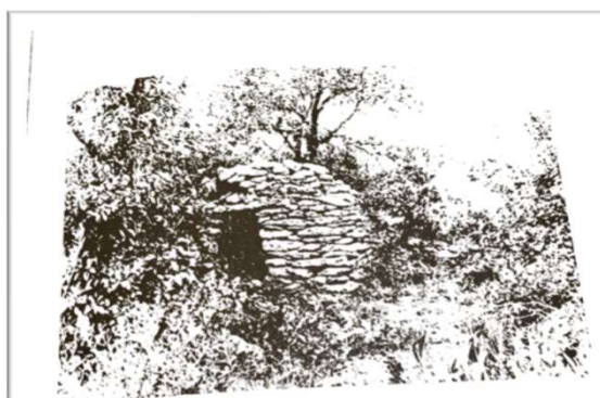
Cabane n°16 - Parcelle 537.

Description : petite cabane quadrangulaire simple enserrée dans une muraille de cl dans une olivette abandonnée. Architecture rustique. Appareillage en grosses pierre Dimensions extérieures : L = 2,00 m x l = 2 ,50 m x H = 1,80 m Etat de la cabane : ruine partielle.